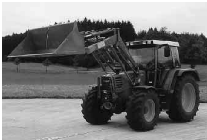
Bild 1: Versuchstraktor mit Frontlader (Fendt 509C, 70 kW, 5400 kg, Radstand 2328 mm)