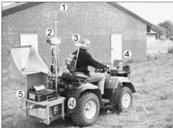
Fig. 1: Vehicle for tracer measurements: 1 ultrasound-anemometer, 2 SF 6 -tracer gas measuring device, 3 GPS-receiver, 4 data logging and storage, 5 power supply and tracer gas basic equipment