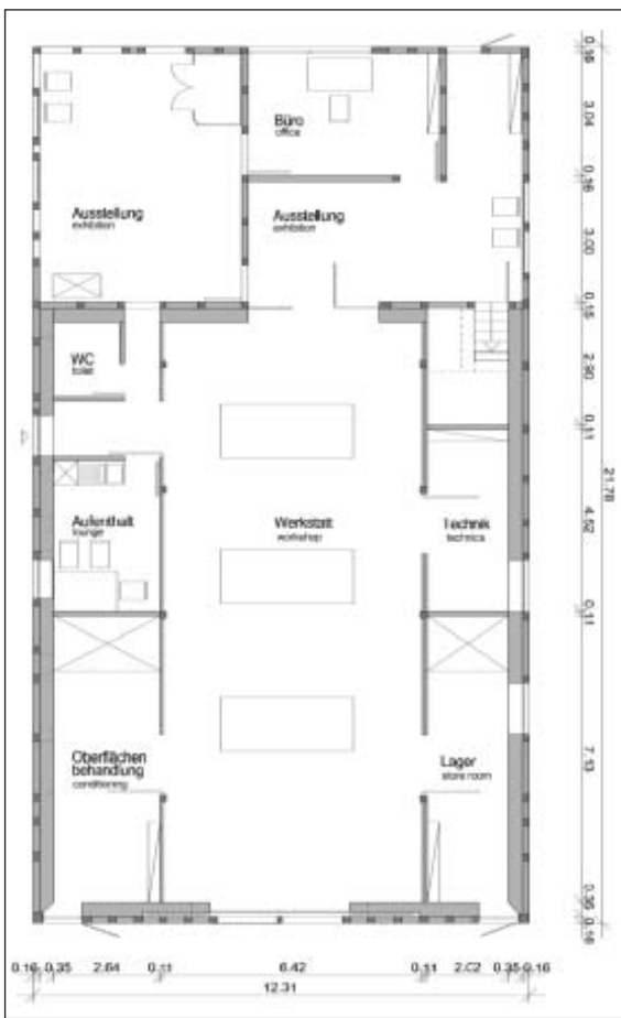
Bild 2: „Restauratorenwerkstatt“ als eine von vier Nutzungsvarianten beim Gebäudetyp Fachwerkhaus