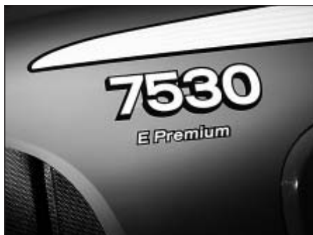
Bild 2: John Deere treibt in seiner Baureihe 7030 E Premium einige Nebenaggregate elektrisch an

Ein direkt an die Kurbelwellen geflanschter Generator produziert bei einer Motordrehzahl von 1800 \text{ min}^{-1} bereits 20 kW elektrische Leistung. Diese wird zum Antrieb des Lüfters, des Luftkompressors und einer Wasserpumpe genutzt und versorgt das 12 Volt Bordnetz, dessen Leistung um über 50 % gesteigert wird. Bei stehendem Fahrzeug können über eine Steckdose Elektro-