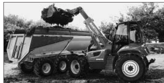
Bild 4: Vor allem für Transportarbeiten empfiehlt Manitou seinen Manitrac, der jedoch auch für andere landwirtschaftliche Arbeiten eingesetzt werden kann

Eine zukunftssträchtige Alternative zum Überladen bildet das feldnahe Silo. Der Transport wird entzerrt, und es entsteht erstmalig in der Landwirtschaft die Chance, auch eine Rückfracht aufzunehmen. Mit einem geeigneten Transportbehälter kann das flüssige Substrat der Biogasanlage zurück zum Feld gebracht werden und auf dem Rückweg die Silage für die Biogasanlage mitgenommen werden. Die Firma SIGA Nova entwickelte hierzu einen Muldenkipper mit doppeltem Boden, der konventionell die Silage aufnimmt. Um Flüssigkeiten zu transportieren, wird der Boden nach oben gefahren und es entsteht ein stabiles Fass.