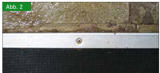
Abb. 2 Befestigung der Matte mit Edelstahlleiste Fig. 2: Fastening of the stainless steel bar