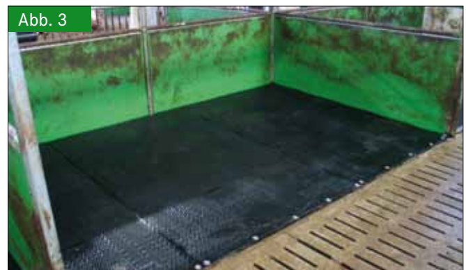
Abb. 3 Gummimatte mit Hammerschlag-Profil und Hartgummirand Fig. 3: Rubber mat with profile „hammer blow“ and hard rubber edge