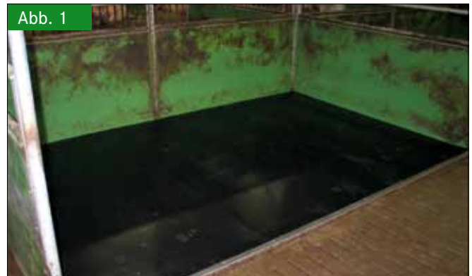
Abb. 1 Gummimatte mit Pyramidenprägung und L-Profil-Edelstahlleiste Fig. 1: Rubber mat with pyramid like surface and L-formed bar of stainless steel

Als Gegenmaßnahme wurden zunächst in den Mulden der Gummimatten Löcher mit einem Lochschneider mit etwa 3 cm Durchmesser geschnitten ( Abbildung 6 ). Der Durchmesser dieser Löcher war damit etwa 1 cm größer als die Öffnungen der darunter liegenden Lochspaltenelemente. Mittels individuell