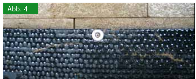
Abb. 4 Befestigung der Matte mit Hartgummirand an den darunter liegenden Lochspaltenelementen Fig. 4: Fastening of the mat with hard rubber edge to the elements of slatted floor below