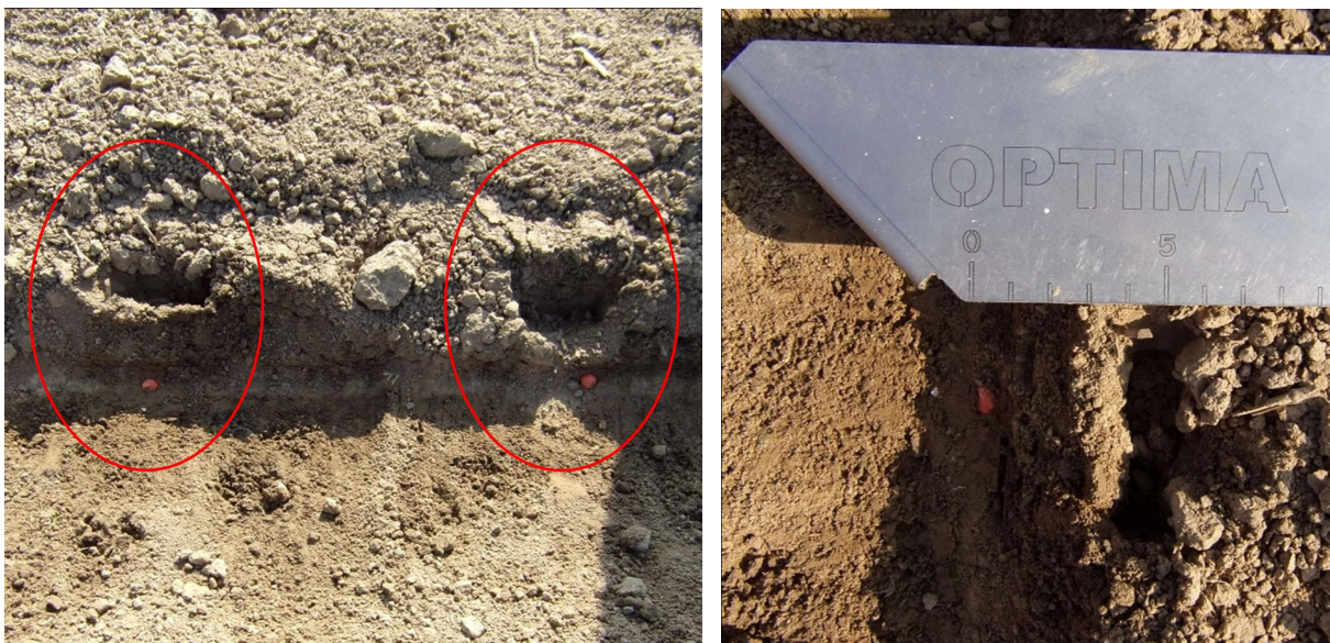
Abbildung 1: Darstellung einer stichprobenartigen Kontrolle der manuellen Düngerapplikation durch Freilegen der Saatkörner und Vermessung des horizontalen Abstandes zwischen Dünger und Saatkorn (rechts)